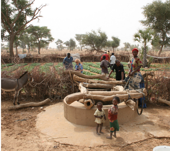
Gandaganda 6 mois après

Nous présentons également l'association et nos actions dans les écoles (primaires, maternelles et même collèges et lycées) dans le cadre des classes d'eau. Puis nous organisons avec les établissements scolaires une animation appelée la Quête de l'eau (les élèves ont une heure pour parcourir la plus grande distance possible en trouvant des parrains et marraines qui leur donnent une somme par kilomètre parcouru). Enfin, nous participons à des événements en proposant des ventes artisanales du Niger comme lors du Forum des associations de Sainte-Savine le 26 août dernier.