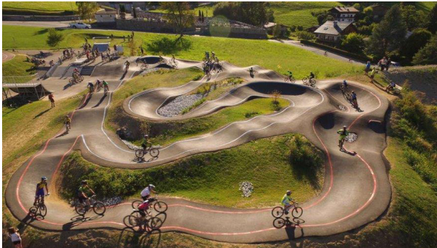
Exemple du pumptrack

Si les investissements sont lourds, la Ville a déjà identifié et sollicité de nombreux cofinancements pour équilibrer le budget global, et a d'ores et déjà prévu d'échelonner les travaux.